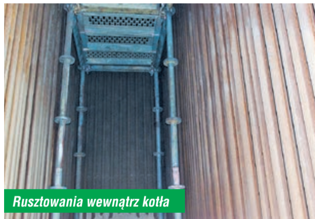
Rusztowania wewnątrz kotła