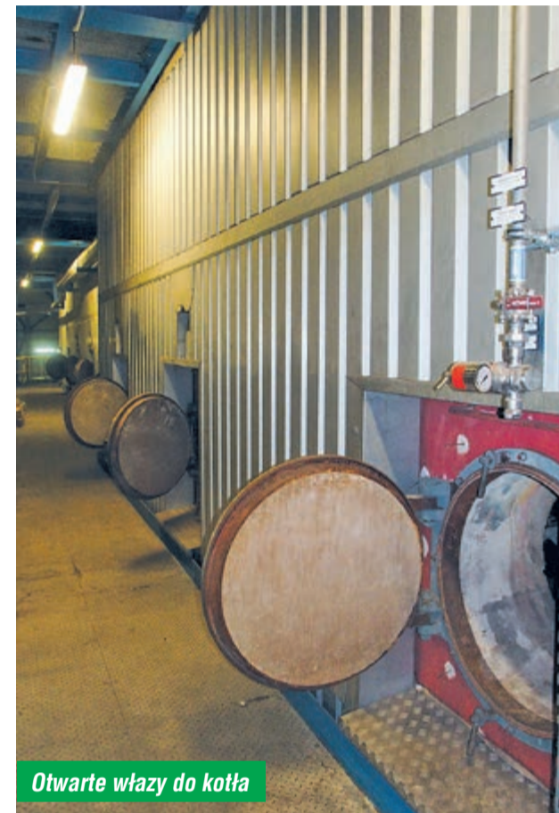
Otwarte włazy do kotła