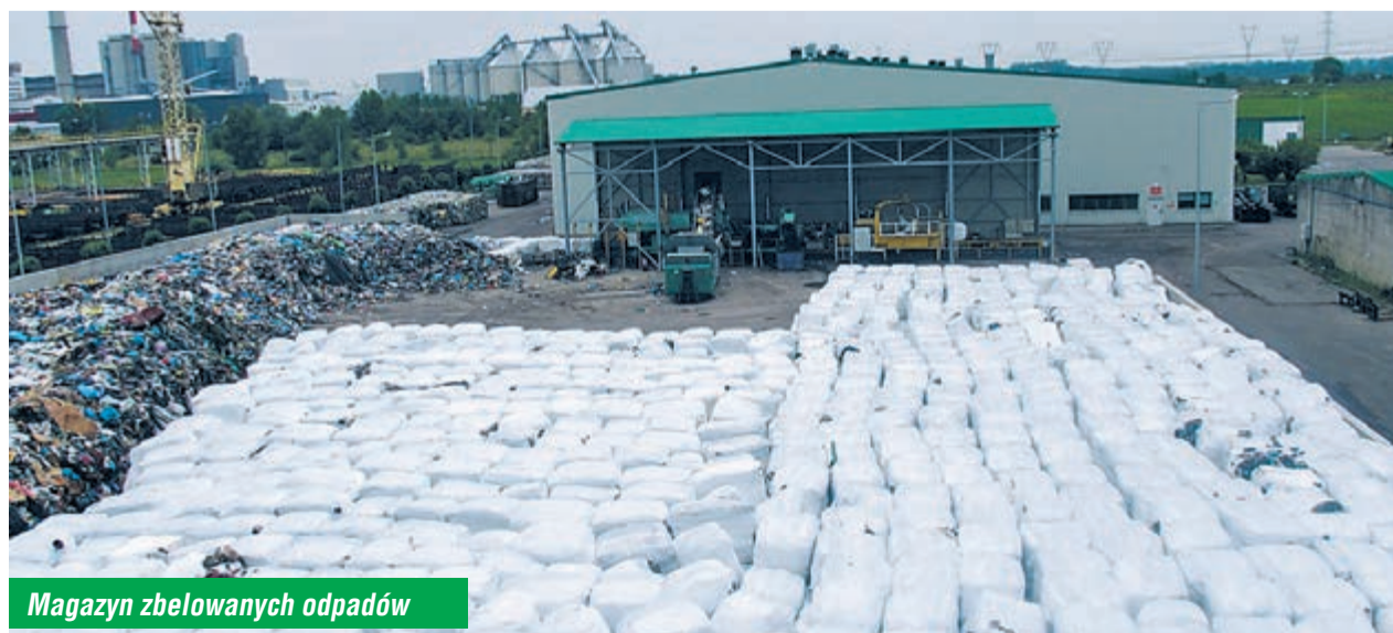
Magazyn zbelowanych odpadów

Prowadzone prace remontowe i postój spalarni nie wstrzymały odbioru odpadów komunalnych od mieszkańców subregionu konińskiego. Wykonawcy firm zewnętrznych bez zakłóceń prowadzili prace remontowe, a pracownicy MZGOK w systemie trzymianowym rozdrabniali i belowali przyjmowane na bieżąco odpady komunalne. W tym roku odpady komunalne mogły zawierać również odpady z miejsc kwarantanny. W czerwcu przyjęto ponad 5.000 ton odpadów, które zostały zbelowane i zmagazynowane na wybudowanym w 2019 roku nowym placu. W kolejnych miesiącach odpady te będą trafiały do bunkra ZTUOK wraz z bieżącym strumieniem odpadów komunalnych.