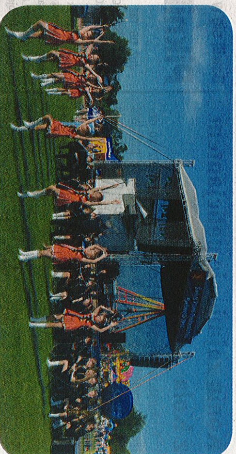
Podczas „Szkolnej estrady” zaprezentowała się Orkiestra „Quantum” z mazuretkami