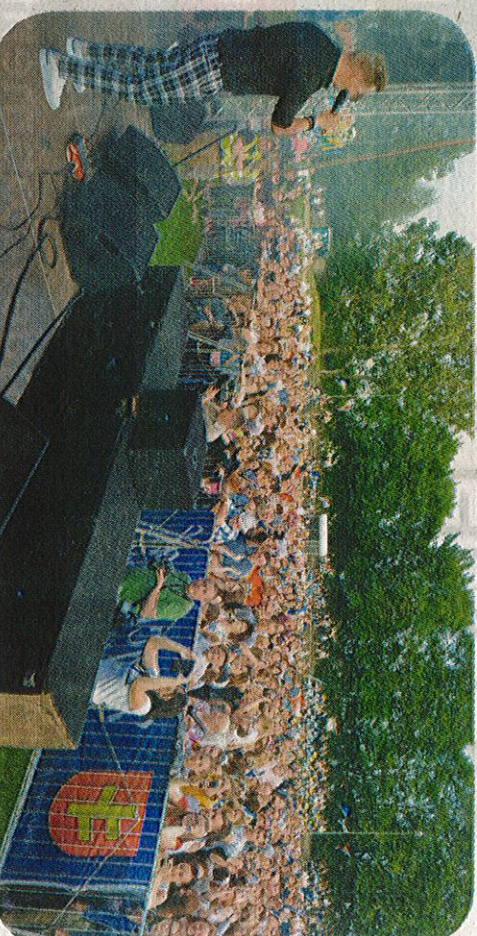
Koncerty zespołów Miga i Łzy przyciągnęły tłumy pod scenę

by posłuchać gwiazdy wieczoru, czyli zespołu Łzy. Tradycją było, że Rychwalia kończono pokazem sztucznych ogní. Jednak w tym roku tego zaniechano. – W trosce o ludzi, zwierzęta oraz środowisko, postanowiliśmy odstąpić od pokazu pirotechnicznego – tłumaczy burmistrz. Rychwalia zakończono zabawą taneczną przy rytmach zespołu Blask alx