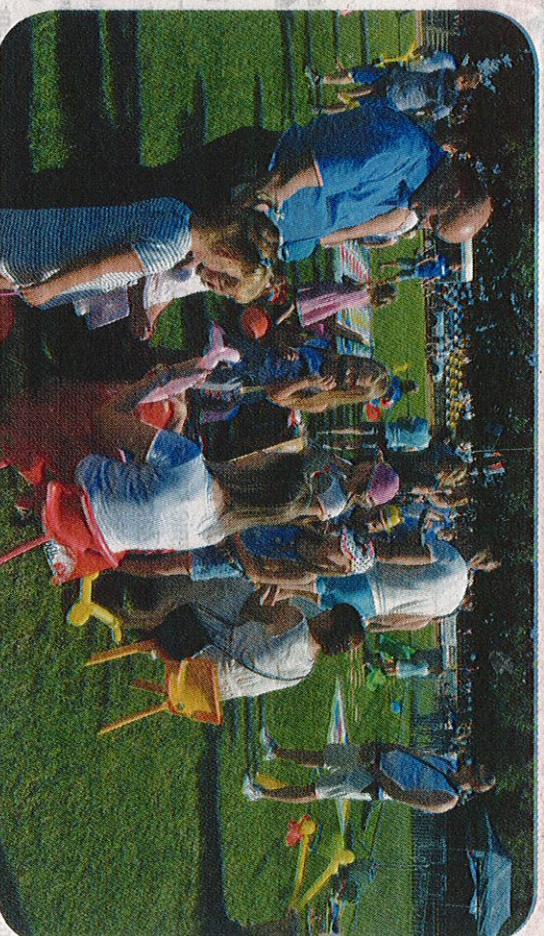
Podczas imprezy nie mogło zabraknąć atrakcji dla najmłodszych mieszkańców gminy