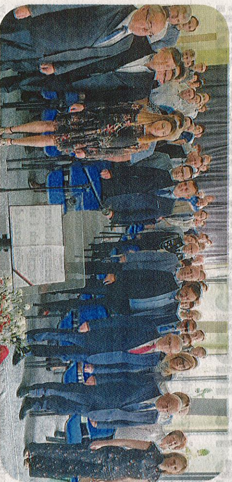
Samorządowcy z gminy Rychwał świętowali jubileusze 30-lecia wolnych wyborów i 15-lecia członkostwa Polski w UE

Równie uroczyste było, gdy na scenę poszono samorządowców z powiatu komińskiego oraz z zaprzyjaźnionych z Rychwalem miast partnerskich z czeskiego Rychwaldu i słowackiego Richvaldu, jak również: Łądką-Zdrój i